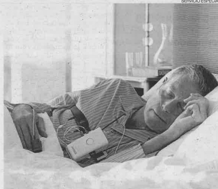
►► Un paciente es sometido a una polisomnografía.

En la edición de este manual ha colaborado la doctora Isabel