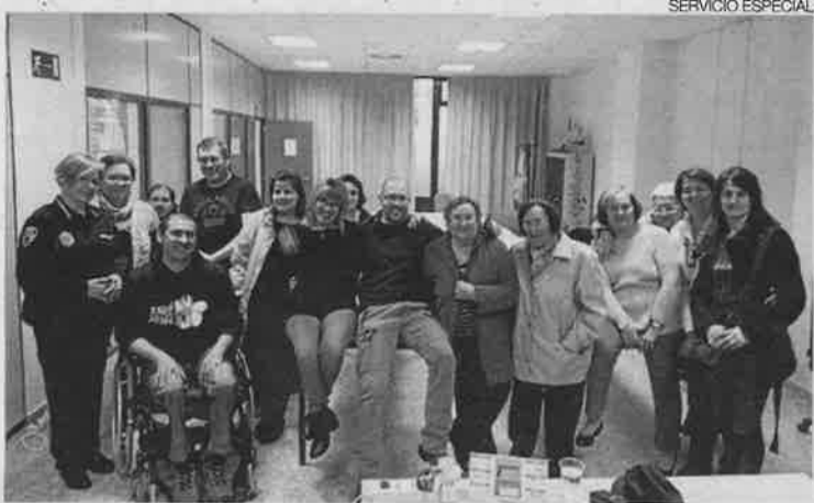
Asistentes al anterior 'Café a las 5'.

en un tema conocido por todos: la escuela. «La escuela es ese territorio pisado por todos, ese tiempo vivido del que guardamos buenos y malos recuerdos, esa