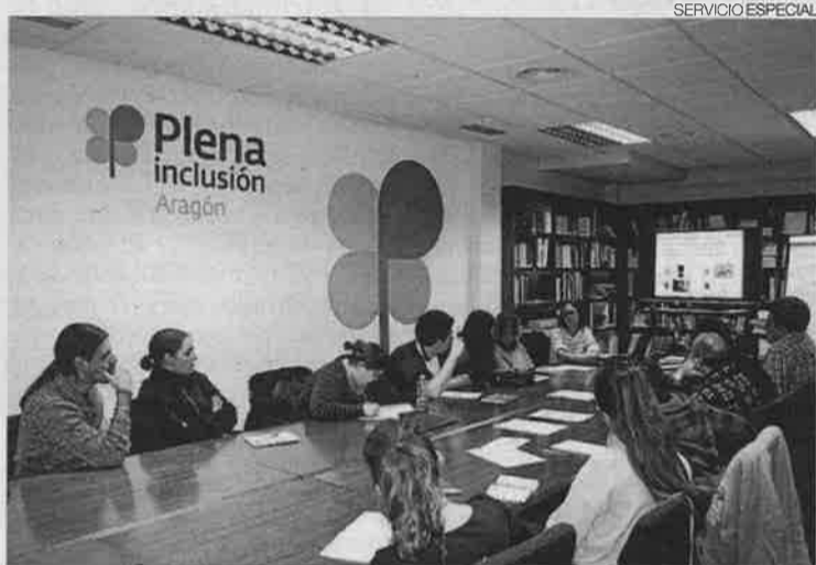
Reunión del grupo denominado Altavoz de la Accesibilidad.

Plena inclusión Aragón ha lanzado una convocatoria para Instituciones, Empresas y Entidades de Zaragoza que quieran hacer